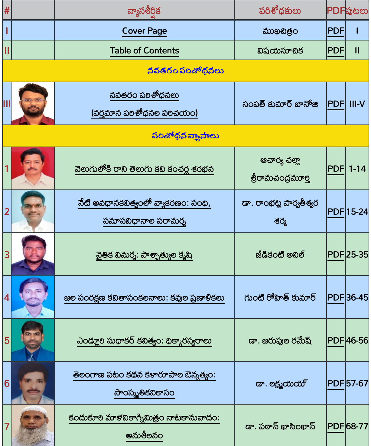
Table of Contents – విషయసూచిక

గమనిక: ఈ సంచికలోని వ్యాసాలలో అభిప్రాయాలు రచయితల వ్యక్తిగతమైనవి. వాటికి సంపాదకులు గానీ, పబ్లిషర్స్ గానీ ఎలాంటి బాధ్యత వహించరు.