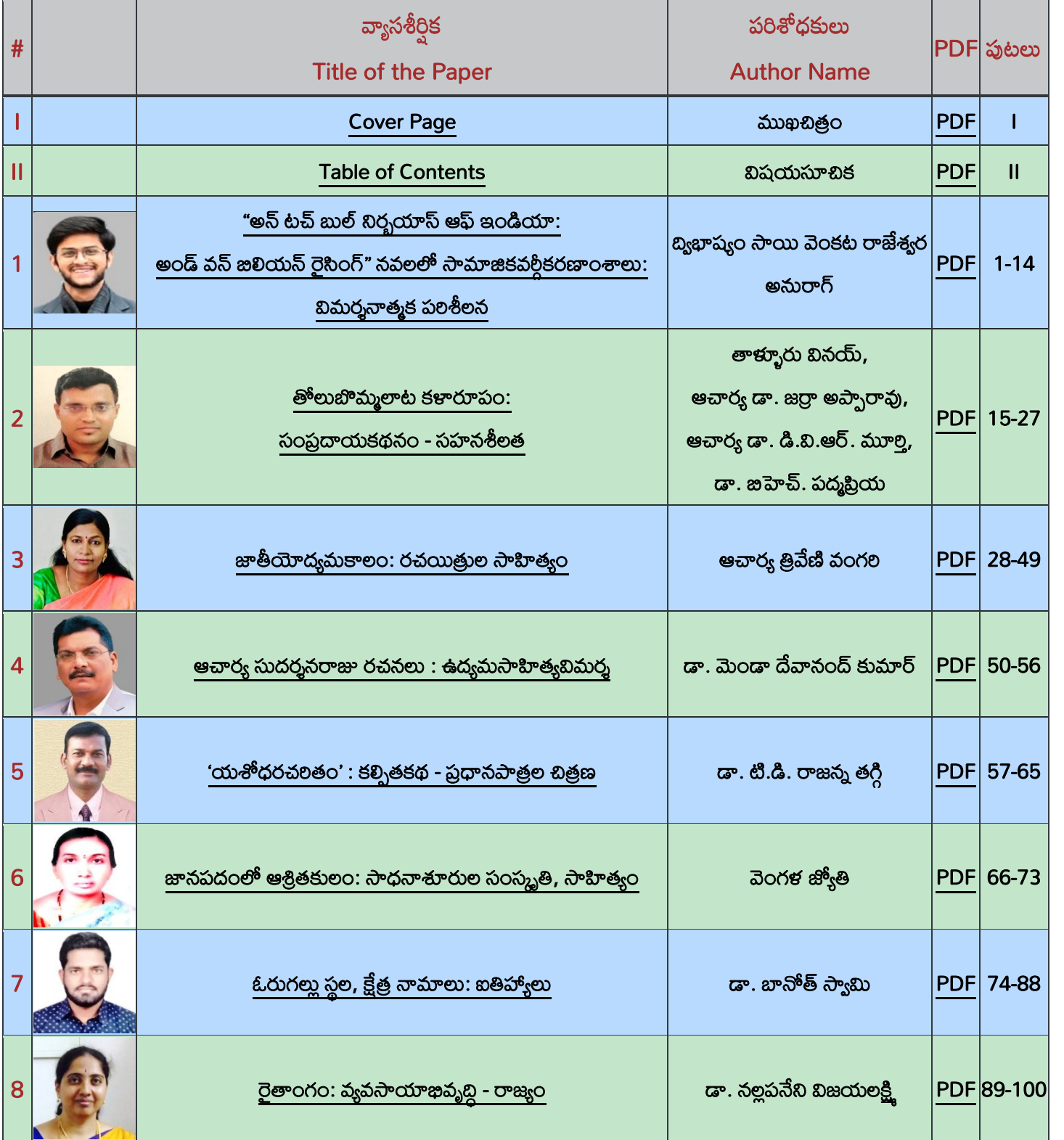
Table of Contents – విషయసూచిక

February - 2025 (Volume-06, Issue-02): ఫిబ్రవరి -2025 (సంపుటి-06, సంచిక-02)