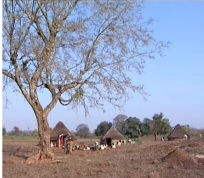
చెంచుగూడెం. (పెంట) కొమ్మన్ పెంట, శ్రీశైలం.