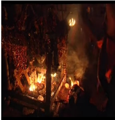
రాత్రి సమయం దీపాల వెలుగులో సలేశ్వర పుణ్యక్షేత్రంలోని శివలింగం.