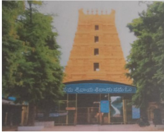
శ్రీశైల చెంచు మల్లన్న దేవస్థానం.