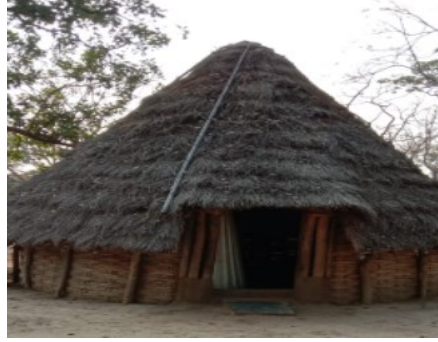
చెంచులు నివసించే గుడిసె