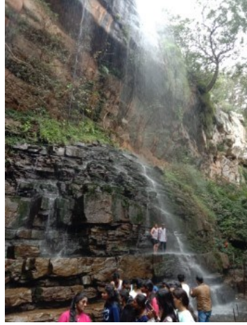
మల్లెల తీర్థ జలపాతం.

మల్లెల తీర్థంలోని (నీటిని) తీర్థాన్ని త్రాగినవారికి ఆయురారోగ్యము లభిస్తుంది. నిత్యయవ్వనుల్లా విలసిల్లుతారు అనే ఒక నమ్మకం ఉంది.