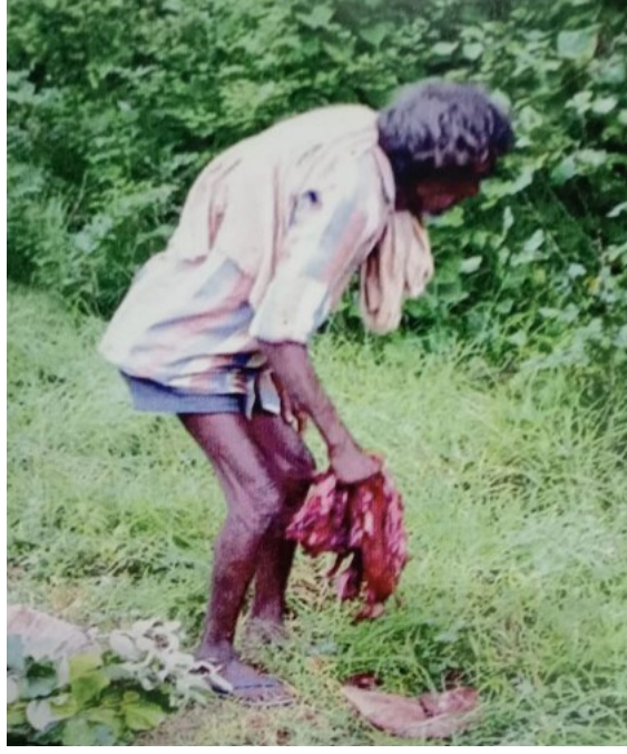
వేట ముగిసిన తర్వాత మాంసాన్ని తీసుకువెళ్తున్న చెంచు.