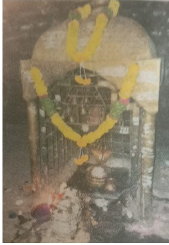
సలేశ్వరం పుణ్యక్షేత్రంలోని కొండ దరిలో ఉన్న పిడికెడు శివ లింగం.

రాత్రివెన్నెలలో ప్రజలు నడిచివస్తారు. వారికి (బాట) రహదారిలో విద్యుత్ తీగల సహాయంతో పై కొండపై నుండి అనగా రాంపూర్ ప్రాంతం నుండి లింగమయ్యస్వామి దేవస్థానం వరకు ట్యూబులైట్లను వెలిగిస్తారు. భక్తులు కాళిబాటలో దైవదర్శనానికి వచ్చే మార్గంలో 60 అడుగుల దూరంలో ఒక్కొక్క వాలెంటీర్లు ఏర్పాటుచేస్తారు. వీరు భక్తులకు ఎటువంటి ప్రమాదం లేకుండా, రాకుండా తమ వంతు కృషిచేస్తారు. ఇలా సేవచేసిన వాలెంటీర్లకు, రోజుకు 250 లేదా 300 రూపాయలు చెల్లిస్తారు. ఈ విధమైన దైవకార్యక్రమాన్ని సర్వమూ చూసుకునేది ఆ ప్రాంతం నల్లమల చెంచులు. వీరు గొప్ప నిజాయితీ కలిగిన దైవభక్తి కలవారు.