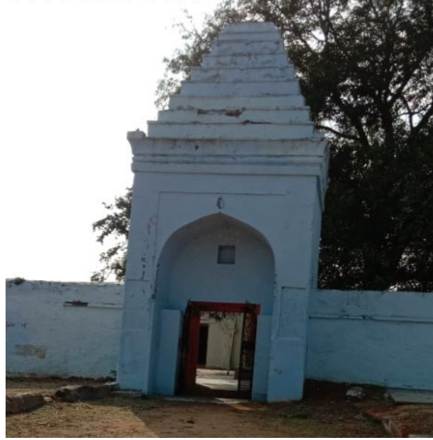
మల్లెల తీర్థ దేవస్థానం.