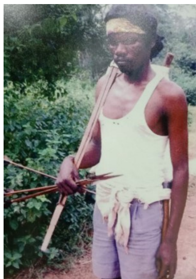
వేటాడడానికి వెళ్తున్న చెంచు.