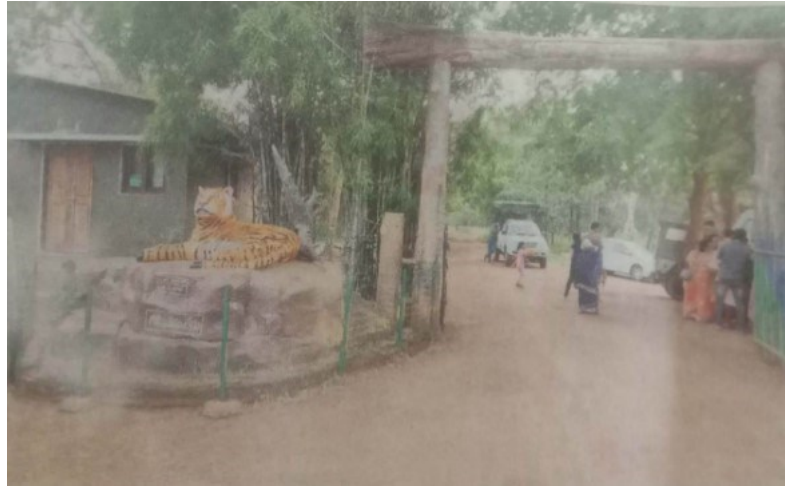
సలేశ్వర పుణ్యక్షేత్రము వెళ్లే ముఖద్వారం.