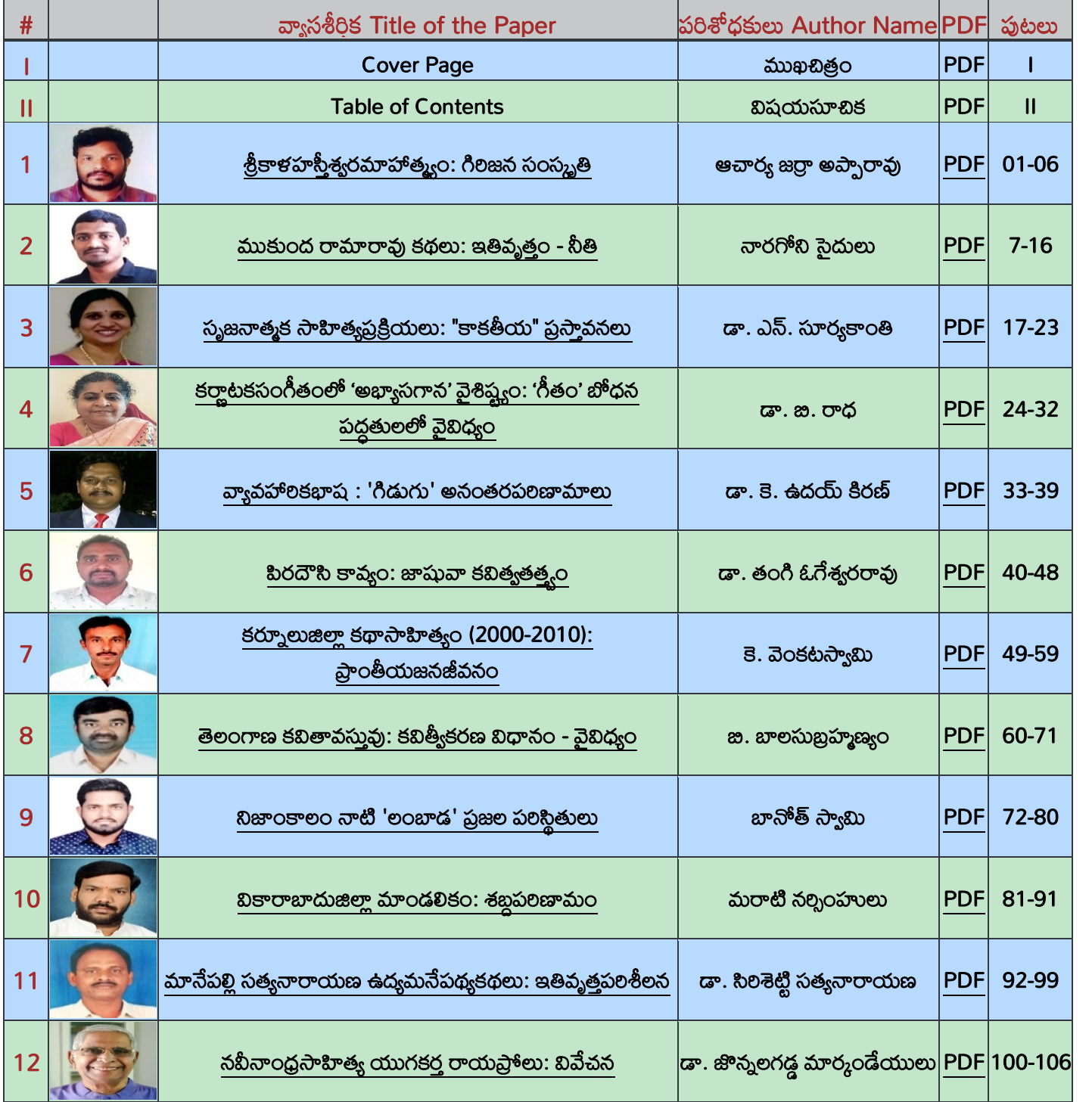
Table of Contents – విషయసూచిక

August - 2024 (Volume-5, Issue-9): ఆగస్ట్ -2024 (సంపుటి-5, సంచిక-9)