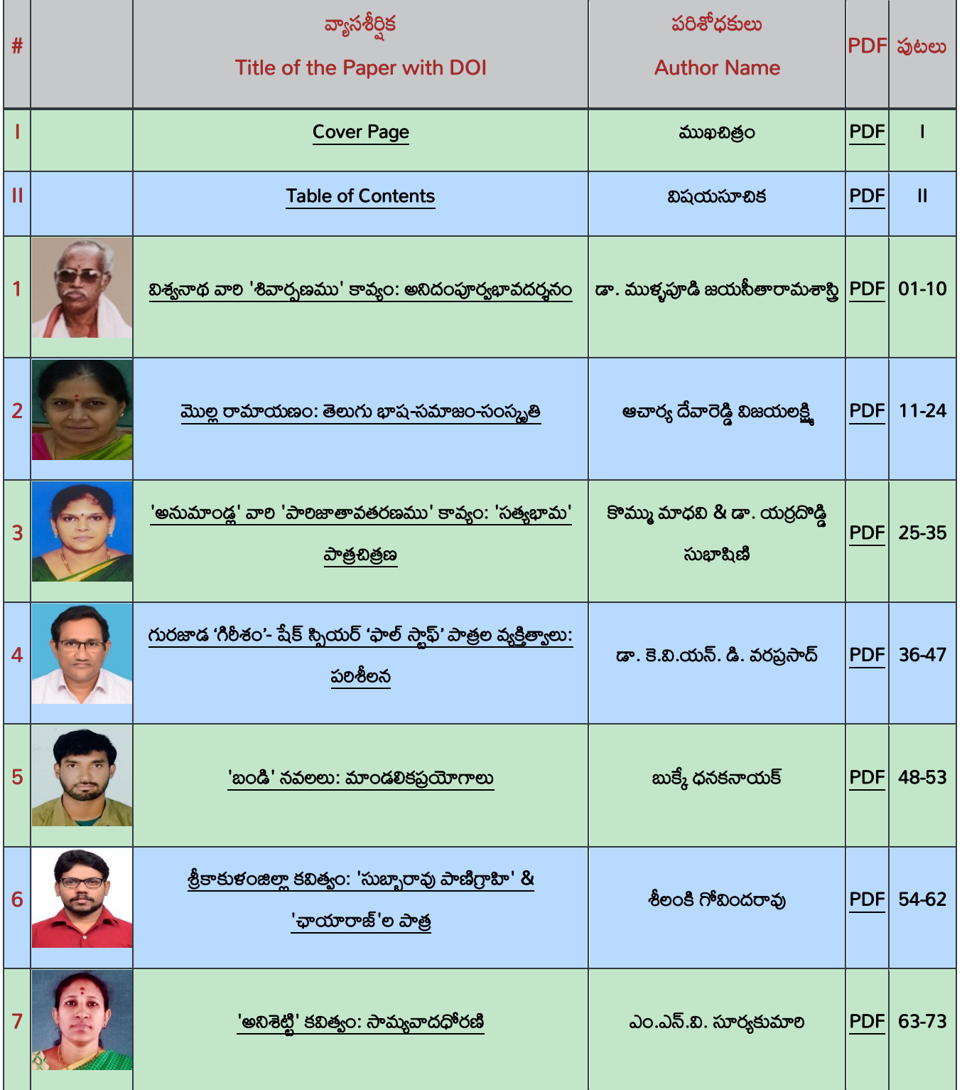
Table of Contents - విషయసూచిక

October - 2023 (Volume-4, Issue 11): అక్టోబర్ - 2023 (సంపుటి-4 సంచిక-11)